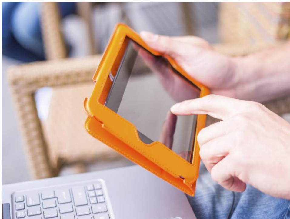
Moduły kompetencji kluczowych w formie e-learningu i m-learningu